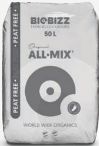
SACS 20L, 50L